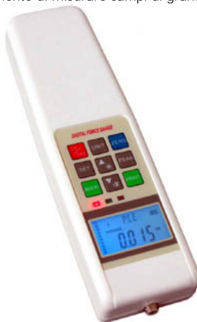
Dinamometro della serie SH con cellula dinamometrica esterna combinata