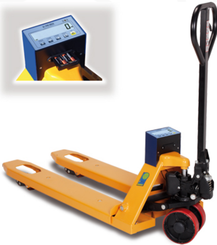
Transpallet pesatore TPWN09