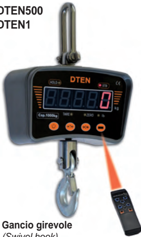
Gancio girevole (Swivel hook)