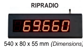
540 x 80 x 55 mm (Dimensions)