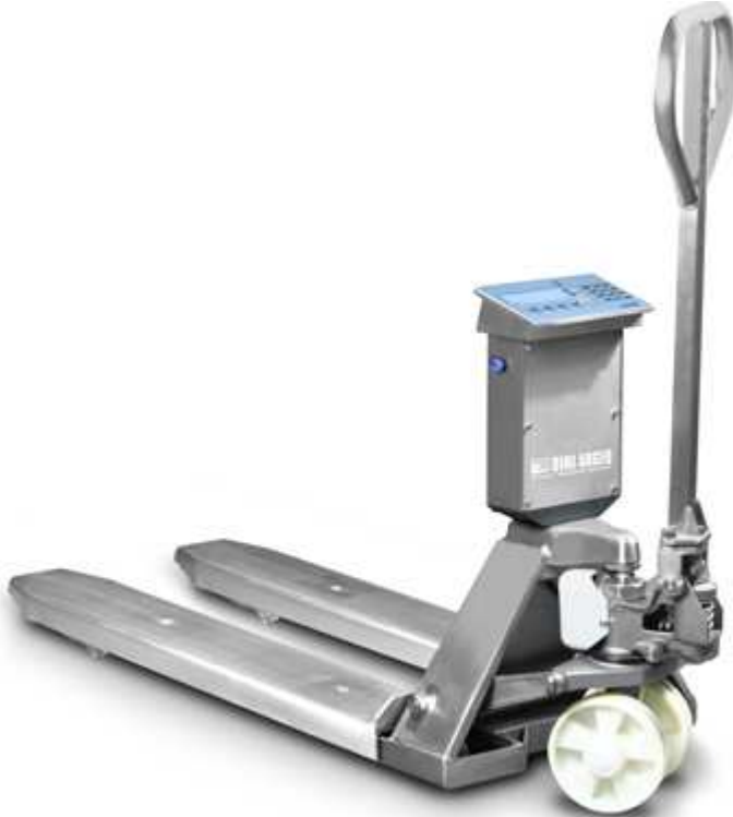
Transpallet pesatore in acciaio INOX

Transpallet in acciaio inox con pesatura elettronica multiscala integrata. Rilevamento del peso a 4 celle di carico in acciaio inox IP68. Facile da utilizzare, robusto e adatto per condizioni gravose di lavoro. Disponibile anche in versione OMOLOGATA CE-M.