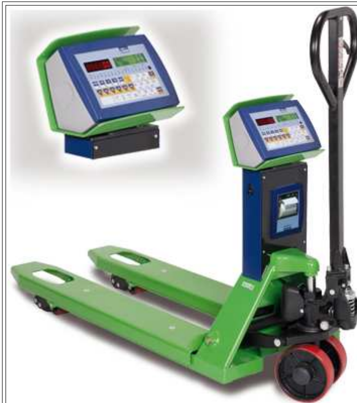
Transpallet pesatore con indicatore elettronico TPWE, con stampante opzionale

Transpallet pesatore completo di indicatore elettronico e gestione avanzata dei dati, indicato per applicazioni di formulazione, conteggio pezzi, totalizzazione, movimentazioni di magazzino, lettura codici a barre, stampe, etichettatura, etc. La vasta gamma di interfacce e di software applicativi disponibili fanno di questo strumento una vera e propria stazione mobile di pesatura integrata al sistema informatico aziendale. Disponibile anche in versione OMOLOGATA CE-M