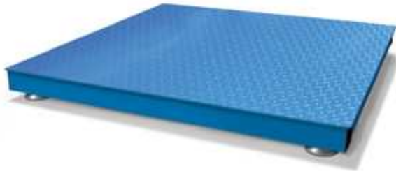
Piattaforme elettroniche di pesatura serie EL.