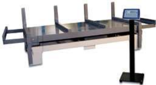
Piattaforme per pesatura profili metallici ESW con colonna opzionale