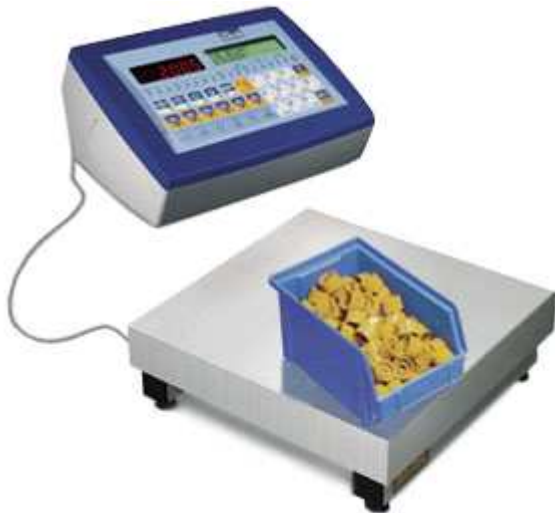
Bilance per conteggio pezzi KDC